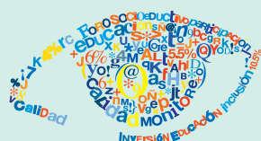
“Observatorio del Presupuesto en Educación”