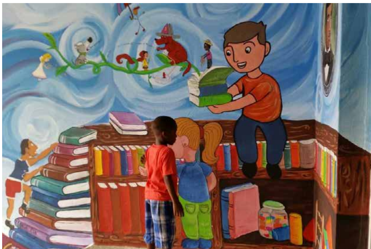
@ Centro Cultural Poveda